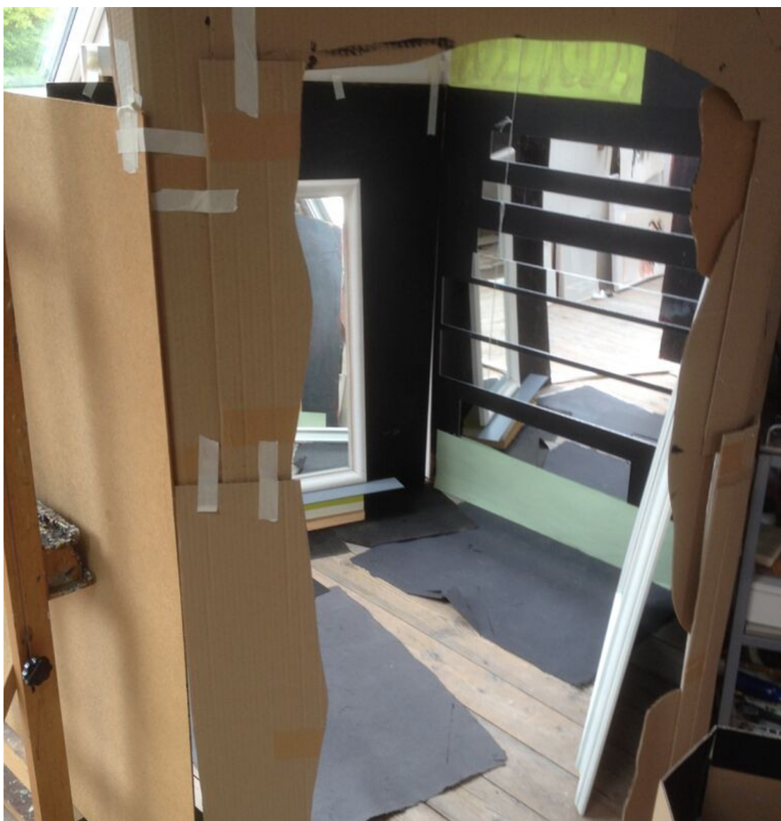
Papmodel af 'Reflection'.